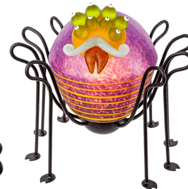
VIOLETT | PURPLE 31-71