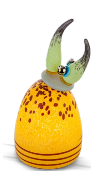
GELB | YELLOW 51-69

TISCHLEUCHTE | TABLE LAMP ‡ 53 CM | 21" ‹ 26 CM | 10"