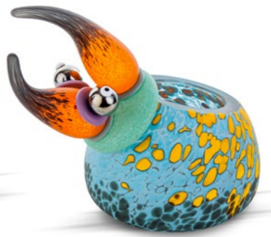
BLAU | BLUE 15-52