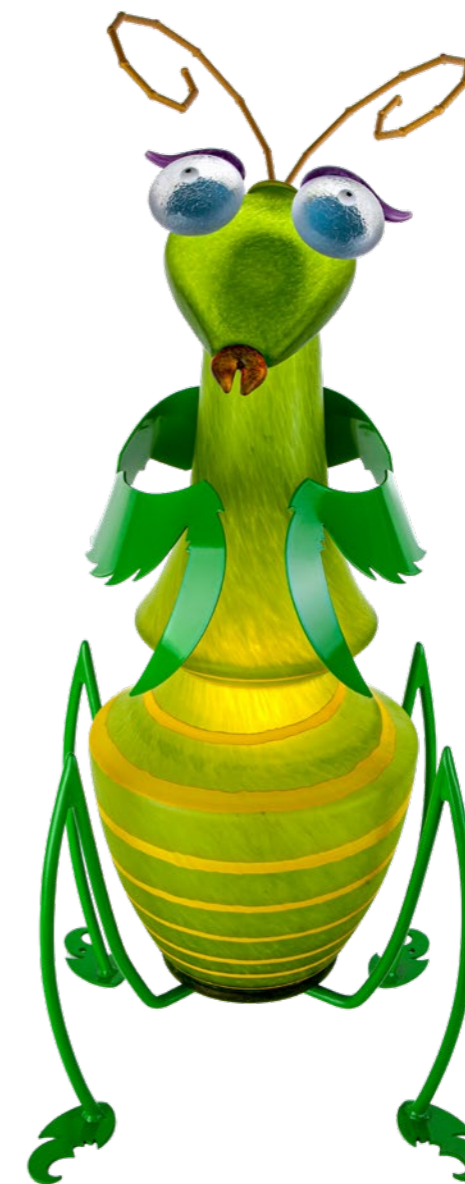
ZITRO | LIME GREEN 31-73