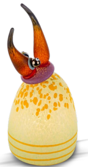
MINTGRÜN | MINT GREEN 51-70