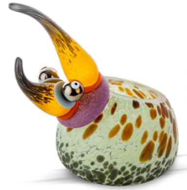
ZITRO | LIME GREEN 15-51