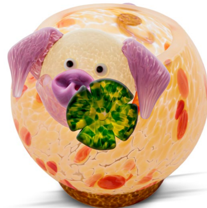
GELB | YELLOW 15-54