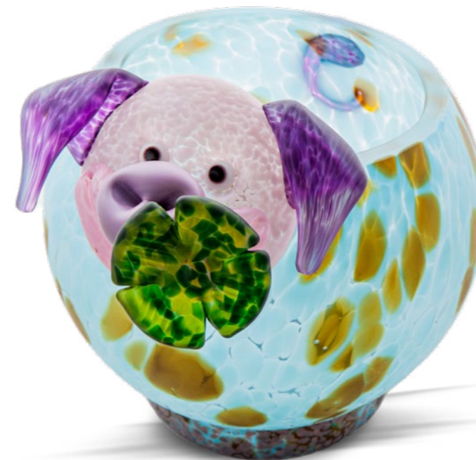
BLAU | BLUE 15-55