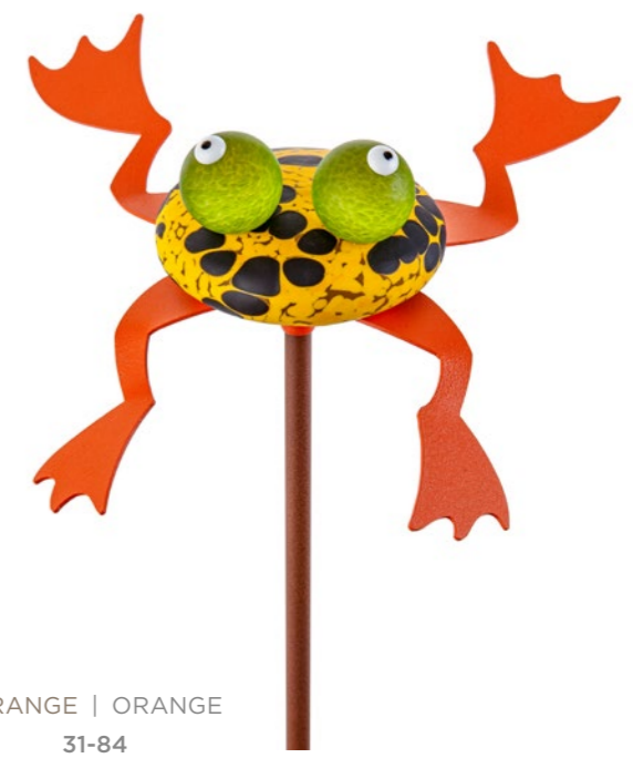
ORANGE | ORANGE 31-84