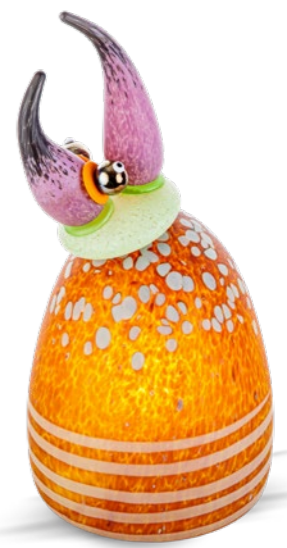
BERNSTEIN | AMBER 51-68