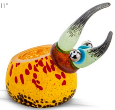
GELB | YELLOW 15-53

SCHALE | BOWL ‡ 25 CM | 4" ‹ 28 CM | 11"