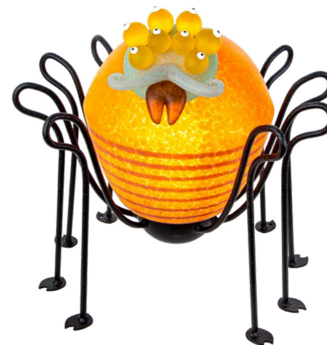
ORANGE | ORANGE 31-72