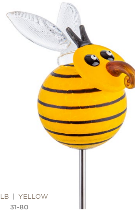
GELB | YELLOW 31-80