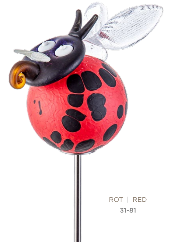
ROT | RED 31-81