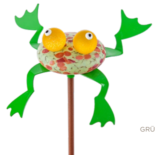
GRÜN | GREEN 31-82