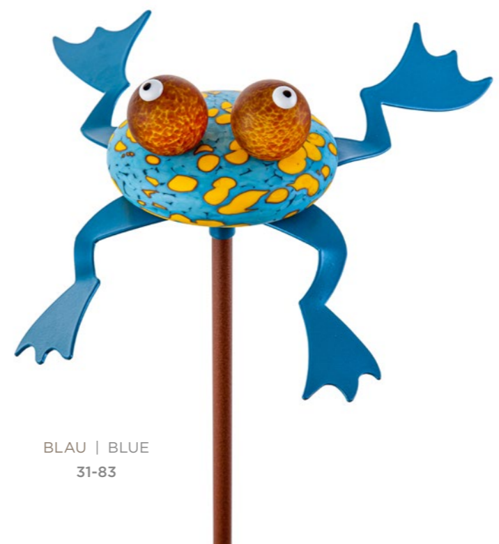
BLAU | BLUE 31-83